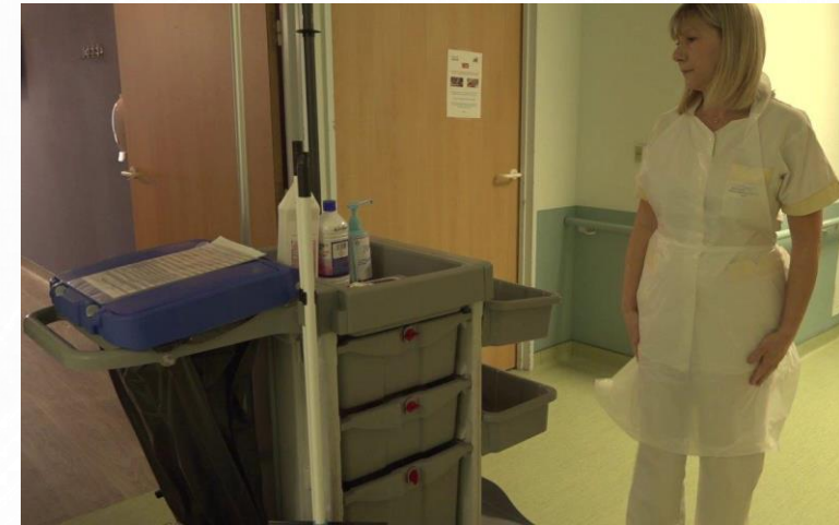
Exemple de cadencier